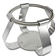
FC-1000 BS-010126-CK morsetto

Morsetto per beute 500 ml - Ø105 mm per UP-168