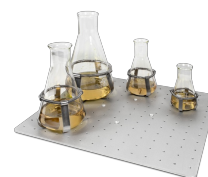
UP-168 BS-010135-JK piattaforma

Piattaforma liscia con tappetino antiscivolo in gomma per piastre di Petri.