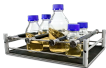
UP-330 BS-010145-AK piattaforma

Piattaforma universale rimovibile che può accogliere contenitori di vetro da laboratorio di diversa forma.