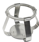
FC-250 BS-010126-JK morsetto

Morsetto per beute 100 ml - Ø65 mm per UP-168