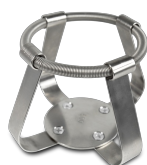
FC-500 BS-010126-LK morsetto

Morsetto per beute 250 ml - Ø85 mm per UP-168