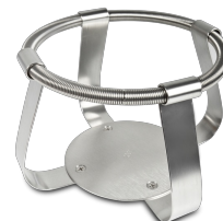
FC-2000 BS-010126-NK morsetto

Morsetto per beute 1000 ml - Ø130 mm per UP-168