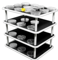
PP-20/4 BS-010126-EK piattaforma

Piattaforma liscia con tappetino antiscivolo in gomma per piastre di Petri.