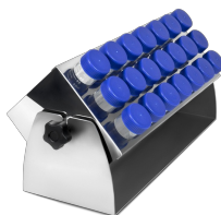
TR-21/50 BS-010135-KK cremagliera

Rack per provette ad angolo regolabile per UP-168