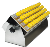
TR-44/15 BS-010135-LK cremagliera

Tappetino biadesivo. SPML può essere utilizzato con piattaforma UP-168 per l'agitatore orbitale Biosan PSU-20i e per gli agitatori orbitali ES-20/80, ES-20/60.