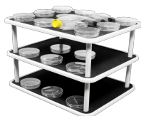
PP-20/3 BS-010126-BK piattaforma

Piattaforma liscia con tappetino antiscivolo in gomma per piastre di Petri.