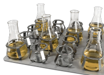
P-16/250 BS-010135-CK piattaforma