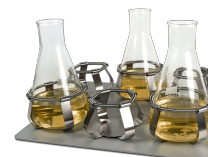
P-6/1000 BS-010135-DK piattaforma