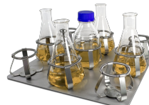
P-9/500 BS-010135-AK piattaforma