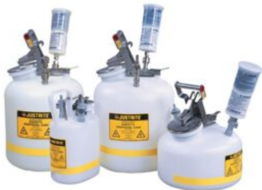
La foto è puramente indicativa

Contenitore di sicurezza rotondo a bocca larga, a sgancio rapido in Polietilene. L'apertura è dotata di un arresta-fiamme in acciaio inossidabile che dissipa il calore in modo da prevenire il ritorno di fiamma. Il laccio fisso sulla maniglia permette al coperchio di rimanere aperto per un facile versamento. Il colore traslucido vi permette di controllare il livello del liquido con una semplice occhiata. L'accumulo di rifiuti liquidi a mani libere è l'ideale per applicazioni HPLC ed è adatto sia per i metodi HPLC a pompa che a gravità. I doppi accessori eliminano il ritorno di fiamma nella distribuzione dei liquidi e forniscono una gestione controllata dei vapori. Il contenitore si ventila automaticamente fra 0,2 e 0,3 bar. Modello con accessori in acciaio inossidabile dotati di O-rings in PTFE. Esistono modelli con raccordi più economici in polietilene che offrono O-rings in EPDM. Scegliete quello compatibile con il solvente trattato dalla vostra unità HPLC.